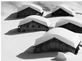
4) Peter Mathis, Laguz #1, Österreich, 2018, Auflage 3/10, 52 x 70 cm, Foto: Peter Mathis