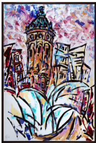
3) Manfred Fuchs, Der Mannheimer Wasserturm mit den Fontänen des Springbrunnens Friedrichsplatz, Acryl auf Leinwand, 120 x 80 cm, 2022