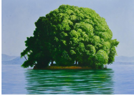
1) Andreas Scholz, Insel im Genfer See, Öl auf Leinwand, 100 x 140 cm, 2022